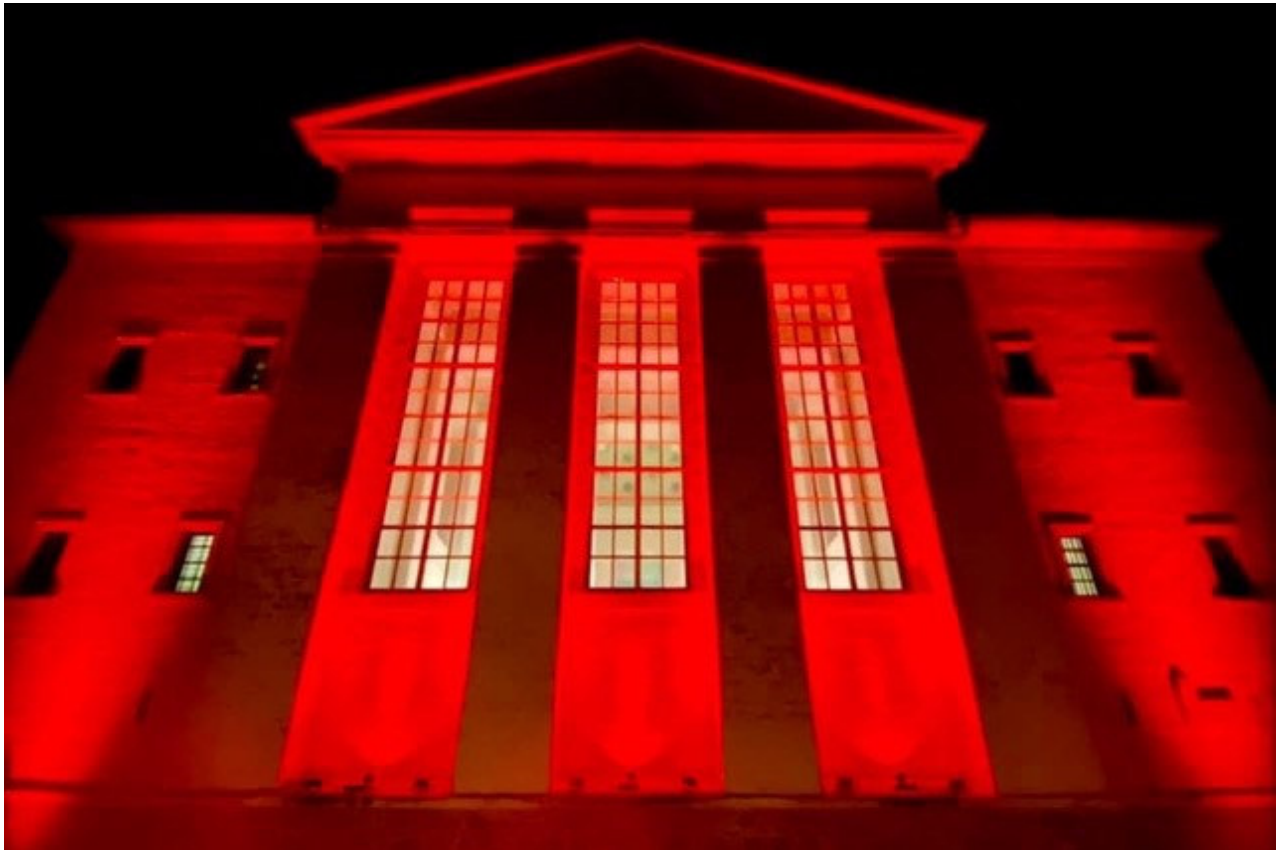
Foto: Schloss- und Pfarrkirche St. Maria Himmelfahrt Köthen, Oliver Pülch 2022

17.00 Uhr ANDACHT für verfolgte und bedrängte Christen