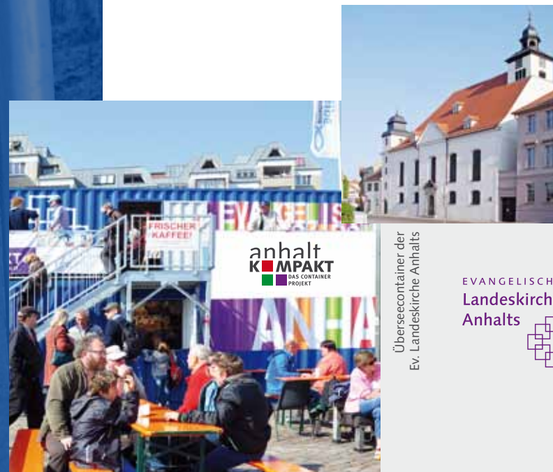
Kirche St. Agnus

Führungen (Fr 16.00 Uhr | Sa 11.00 Uhr, 15.00 Uhr | So 14.00 Uhr)