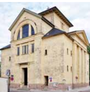
Kirche St. Maria